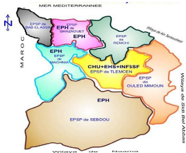
implantation des Hopitaux